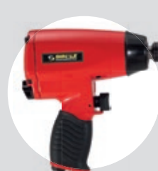
Chave de Impacto 1/2" SFIC 480