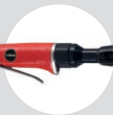
Chave de Catraca 1/2" SFCC 70