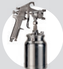
Pistola de Pintura Alta Pressão SPP AP02