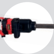
Chave de Impacto 1" longa 8" SFIC 2000L