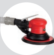
Lixadeira Roto Orbital 6" SFLC 11