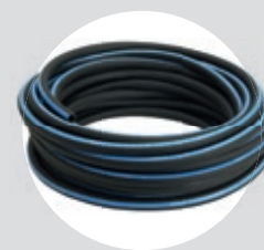
Mangueira PT 300 3/8" 10 m