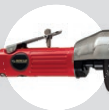
Serra de Corte 3" SFPC 20