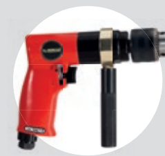
Furadeira 1/2" Reversível SFFC 12