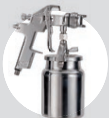
Pistola de Pintura SPP HVLP 02