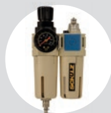
Filtro Regulador Lubrificador FRL