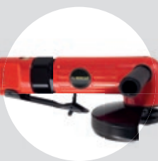
Esmerilhadeira Angular 5" SFDC 11