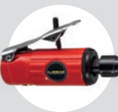
Mini Retífica Reta 1/4" SFRC 25