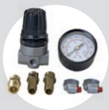
Regulador de Pressão e Manômetro

Acessórios recomendados para acompanhar o alto desempenho dos compressores da Série Especial 60 Anos Schulz: