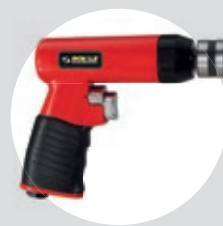
Furadeira 3/8" Reversível SFFC 38