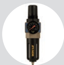
Filtro Regulador FR