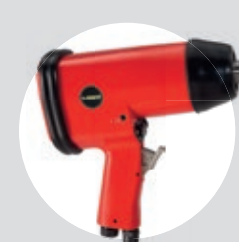
Chave de Impacto 3/4" SFIC 750